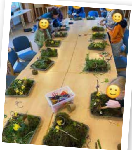
Beim Kinderbibeltag entstanden wunderschöne Ostergärten.