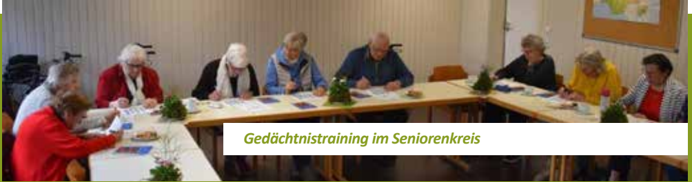
Gedächtnistraining im Seniorenkreis