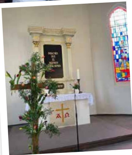
Im Ostergottesdienst in der Marienkirche wurde das Kreuz geschmückt