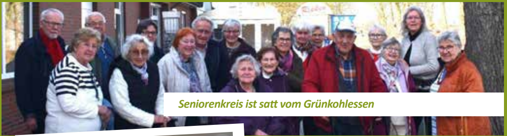
Seniorenkreis ist satt vom Grünkohlessen