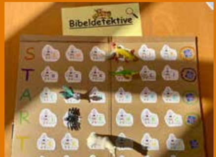
Spannendes Rätselraten bei den Kirchendetektiven in der Matthäus-Kirche.