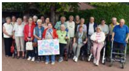
Seniorenkreis besucht Tagespflege in Wardenburg