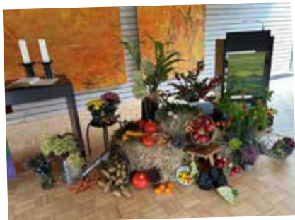
Erntedankgaben in Sandkrug