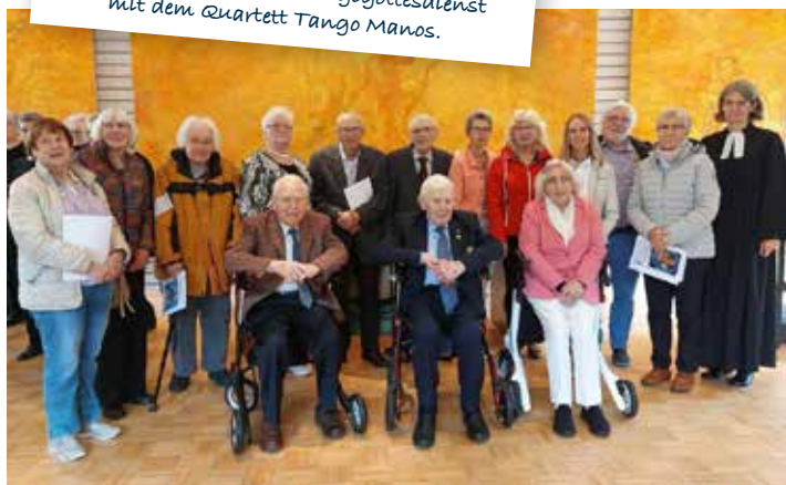
Jubelkonfirmationen in Sandkrug