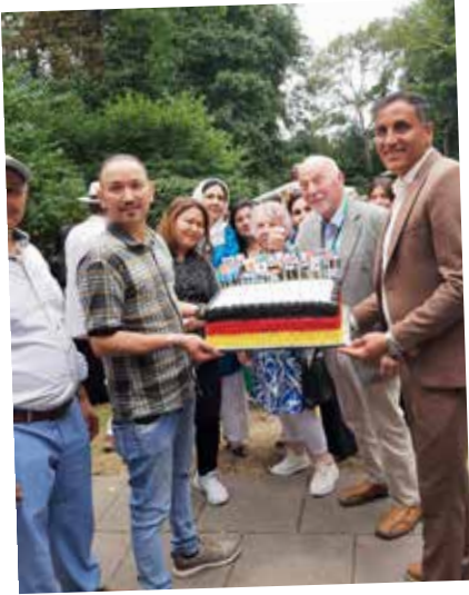
10 Jahre Flüchtlingshilfe/Teehaus Wardenburg, was für ein Fest.